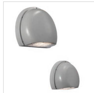
INDU WALL PACK est disponible en deux tailles (deux puissances lumineuses) pour offrir la solution la mieux adaptée.

Adapté à diverses applications telles que l'extérieur des bâtiments, les couloirs extérieurs, les garages, les sentiers périphériques, les escaliers et autres environnements extérieurs, INDU WALL PACK n'offre pas seulement un éclairage économe en énergie. Il améliore la sécurité et le confort des personnes qui travaillent dans un complexe industriel ou qui s'y rendent comme visiteur.