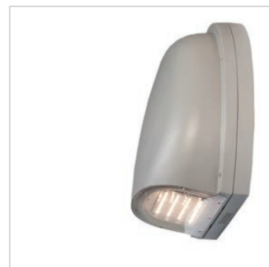
Cette applique murale économique offre un design simple et robuste.