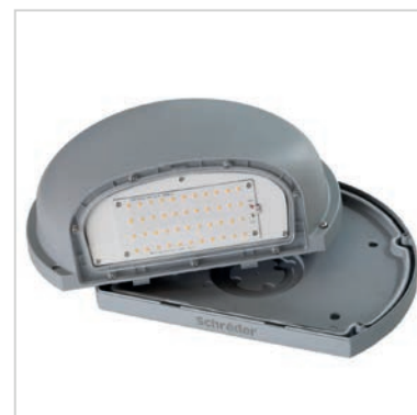
La platine arrière amovible facilite l'installation sur n'importe quelle surface.