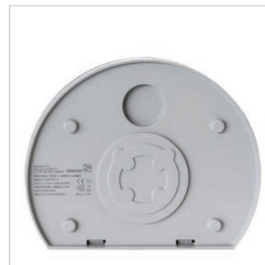
INDU WALL PACK se fixe au mur avec 4 vis.